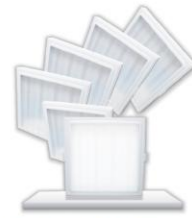
無眩光低藍光 健康平板燈