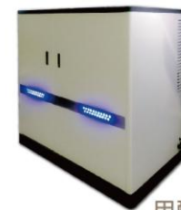
甲醇燃料電池 發電系統